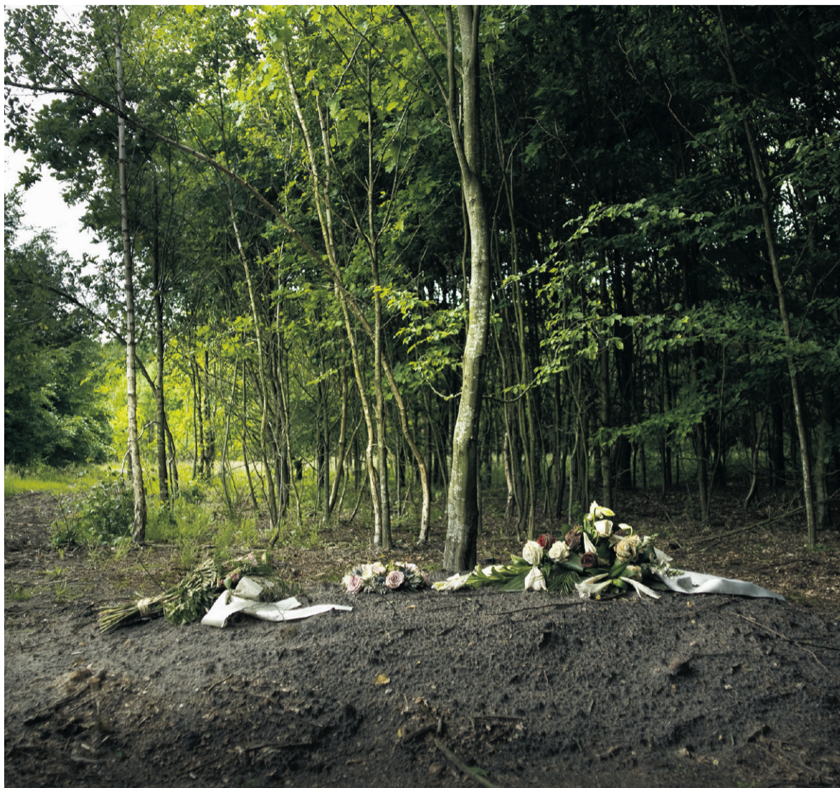
Op Hillig Meer worden bloemen twee weken na de begrafenis weggehaald.

Mensen vinden eeuwige grafurust prettig, ook voor hun nabestaanden. Dat dit de plek is waar ze altijd zullen liggen